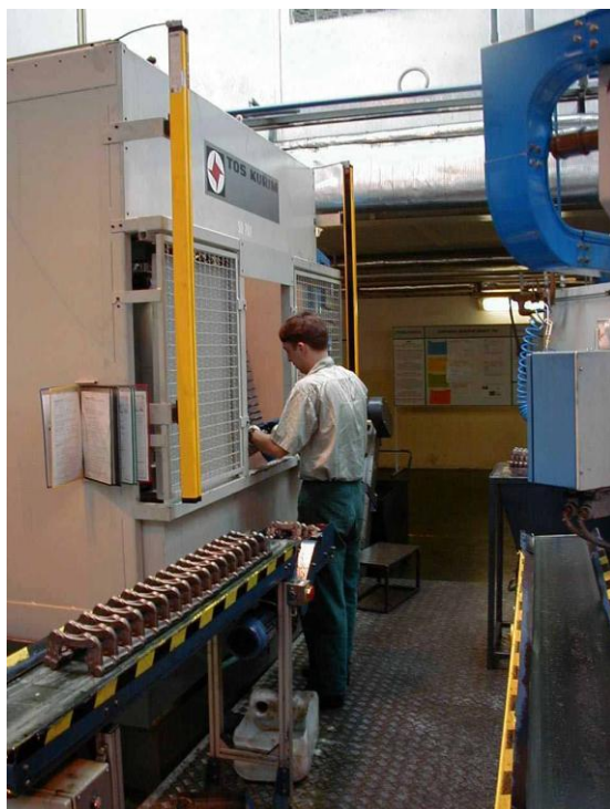
Фото технологической линии

Линия состоит из 4 рабочих 3D модулей с управлением CNC, кабинный вариант исполнения. Модули соединены конвейером для деталей. Линия оснащена стружечным хозяйством, а каждый из модулей – отсасывающим устройством.